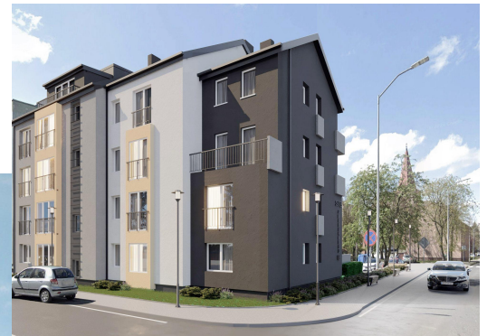
WIDOK WSCH od PN