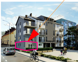
WIDOK BUDYNKU - ZACHODNI od północny